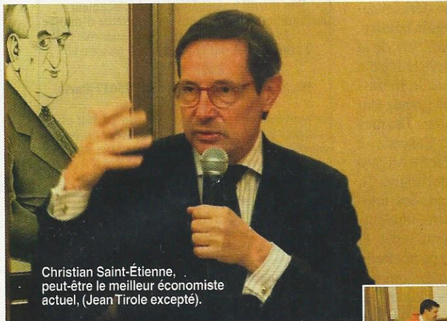
Christian Saint-Étienne, peut-être le meilleur économiste actuel. (Jean Tirole excepté).

U n peu d'histoire : 1780 - la machine à vapeur, 1880 - l'électricité, 1980 - l'informatique, un rythme centenaire pour les 3 grandes révolutions industrielles.